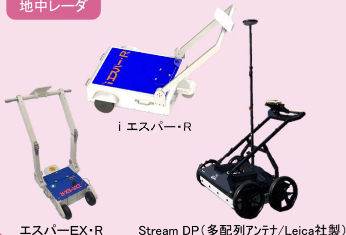
i エスパ- R