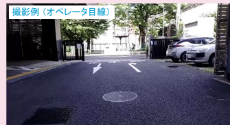
撮影例(オペレータ目線)