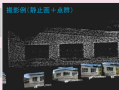
ステレオカメラ(BLK3D/Leica社製)