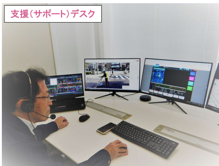
支援(サポート)デスク