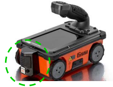
【電線判別ユニット】