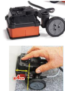
【キューブアンテナ】