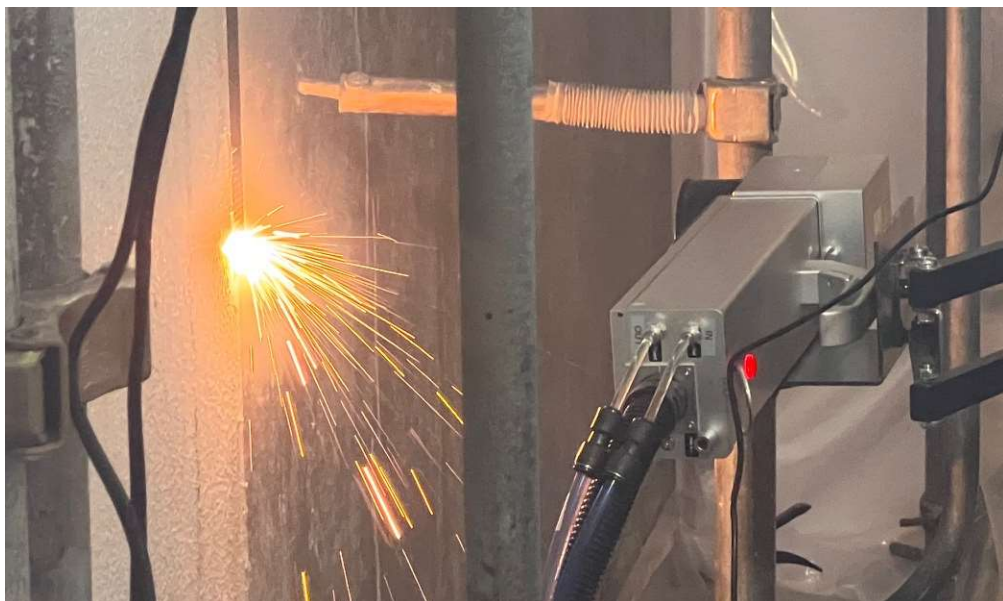
ハイパワーレーザーによるアスベスト除去の検証状況